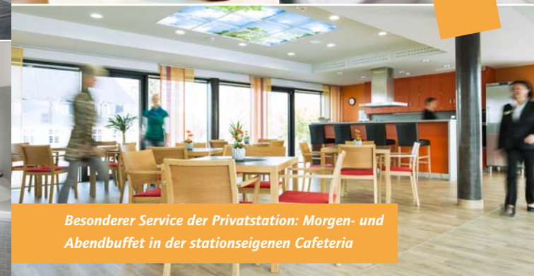
Besonderer Service der Privatstation: Morgen- und Abendbuffet in der stationseigenen Cafeteria