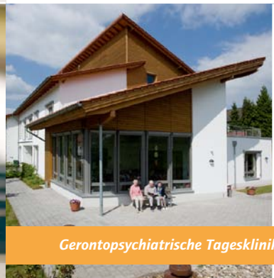
Gerontopsychiatrische Tagesklinik in Horn-Bad Meinberg

Die Gerontopsychiatrie beschäftigt sich mit Menschen im mittleren und höheren Lebensalter. Der Abschied vom Berufsleben, der Verlust nahe stehender Personen, das Nachlassen der Körperkräfte oder psychische Krankheiten im Alter stellen den Menschen selbst und seine Angehörigen vor scheinbar unlösbare Probleme. Die gerontopsychiatrische Tagesklinik in Horn-Bad Meinberg bietet teilstationäre Betreuung an. Diese findet montags bis freitags von 8:00 Uhr bis 16:15 Uhr statt. Außerhalb dieser Zeit leben die Patienten weiterhin in ihrer gewohnten häuslichen Umgebung.