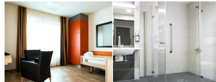
Komfortable Zimmer mit gehobener Ausstattung und Bad