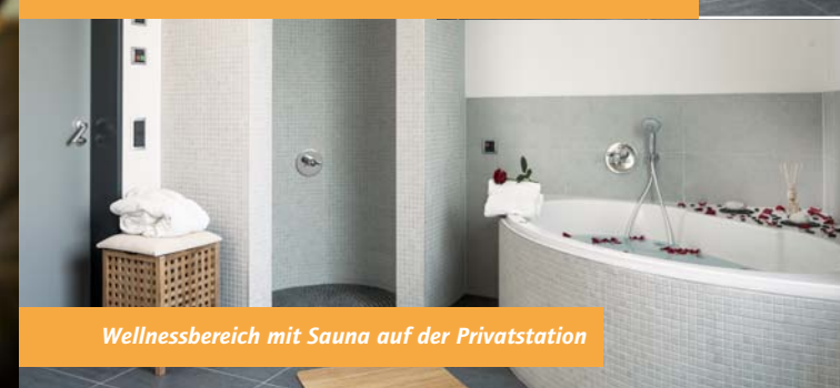
Wellnessbereich mit Sauna auf der Privatstation