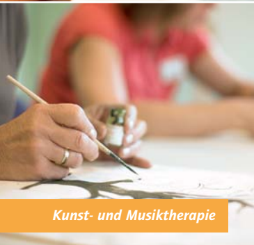
Kunst- und Musiktherapie