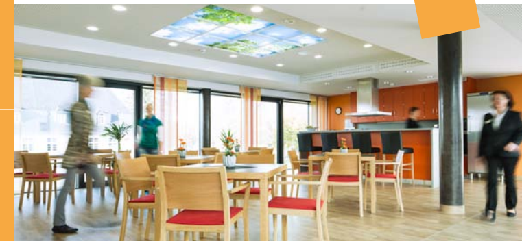
In der Cafeteria stehen Obst und Erfrischungsgetränke immer bereit