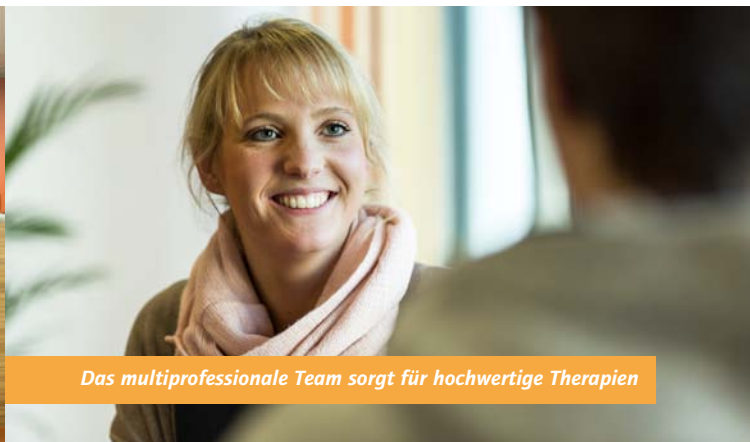
Das multiprofessionale Team sorgt für hochwertige Therapien