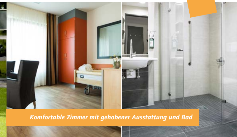
Komfortable Zimmer mit gehobener Ausstattung und Bad