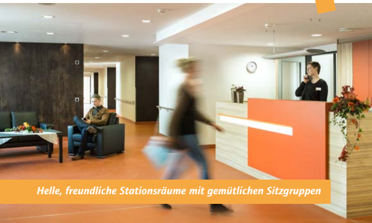
Helle, freundliche Stationsräume mit gemütlichen Sitzgruppen

Das Gemeindepsychiatrische Zentrum in Detmold fügt sich harmonisch in das grüne Umfeld ein. Ein großzügiges Netz von Wegen und Plätzen bietet den psychisch kranken Menschen viele Möglichkeiten, sich zu bewegen und in der Natur zu verweilen.