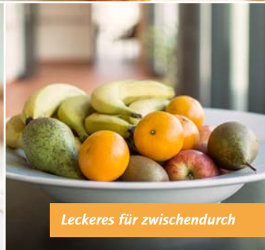
Leckeres für zwischendurch