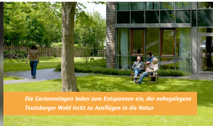
Die Gartenanlagen laden zum Entspannen ein, der nahegelegene Teutoburger Wald lockt zu Ausflügen in die Natur